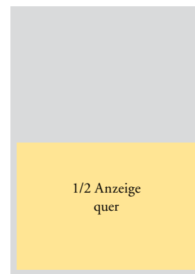
1/2 Seite quer 210 x 125 (+ 5 mm Beschnitt außen.) Ein- Mehrfarbig